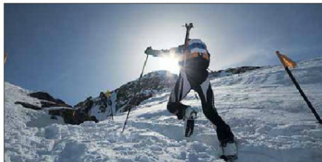
Bei guten Bedingungen werden die Besten ermittelt.