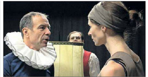
Drei Schauspieler bestreiten das ganze Stück.

Kartenvorverkauf in allen Athesia Buchhandlungen, Bazar (Bozen), Non Stop Music (Meran) und unter www.athesiaticket.it und www.ticketone.it .