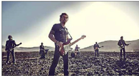
Peter Maffay und seine Band feiern Erfolge.

Premiere: 4. März, 20 Uhr, Stadttheater Bozen, Studio – Alle weiteren Termine: www.theater-bozen.it